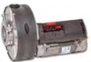
Winner Pro 600/200

É o modelo indicado para a automatização do fechamento de grades enroláveis até um peso de 125 Kg, com a possibilidade de incluir um electrofreio para bloqueio do fecho. Polia 200/220 eixo 42/48/60.