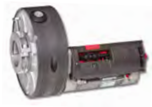
Winner Pro 400/200