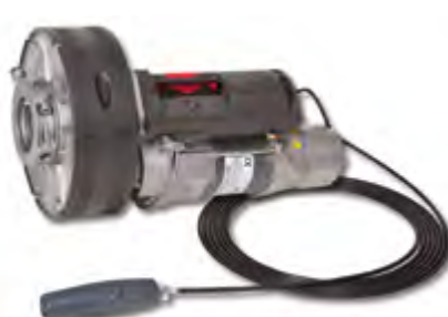
Winner Pro 600/200 EF

con electrofreno with electrobrake avec électrofrein com electrofreio