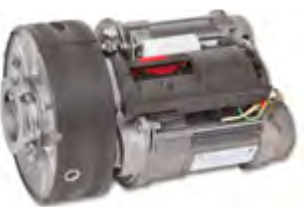
Winner Pro 1200/200 bimotor

É o modelo indicado para a automatização do fechamento de grades enroláveis, até um peso de 170 Kg, com a possibilidade de incluir um electrofreio para bloqueio do fecho. Polia 200/220 eixo 42/48/60.