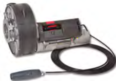
Winner Pro 400/200 EF

con electrofreno with electrobrake avec électrofrein com electrofreio