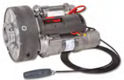
Winner Pro 1200/200 EF bimotor

con electrofreno with electrobrake avec électrofrein com electrofreio