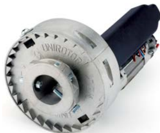
RL60FC 1 und.