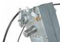
Desbloqueo externo. Conjunto de herrajes que permiten el desbloquear el operador desde el exterior (necesita maneta).